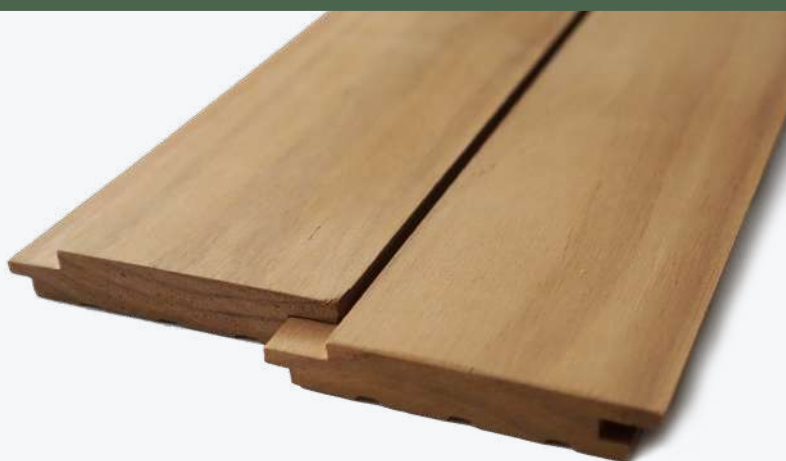
COLOR NATURAL DEL PINO TERMOTRATADO