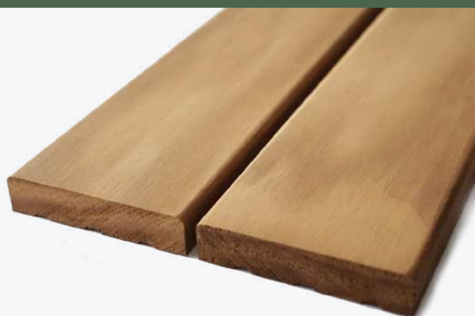
COLOR NATURAL DEL PINO TERMOTRATADO